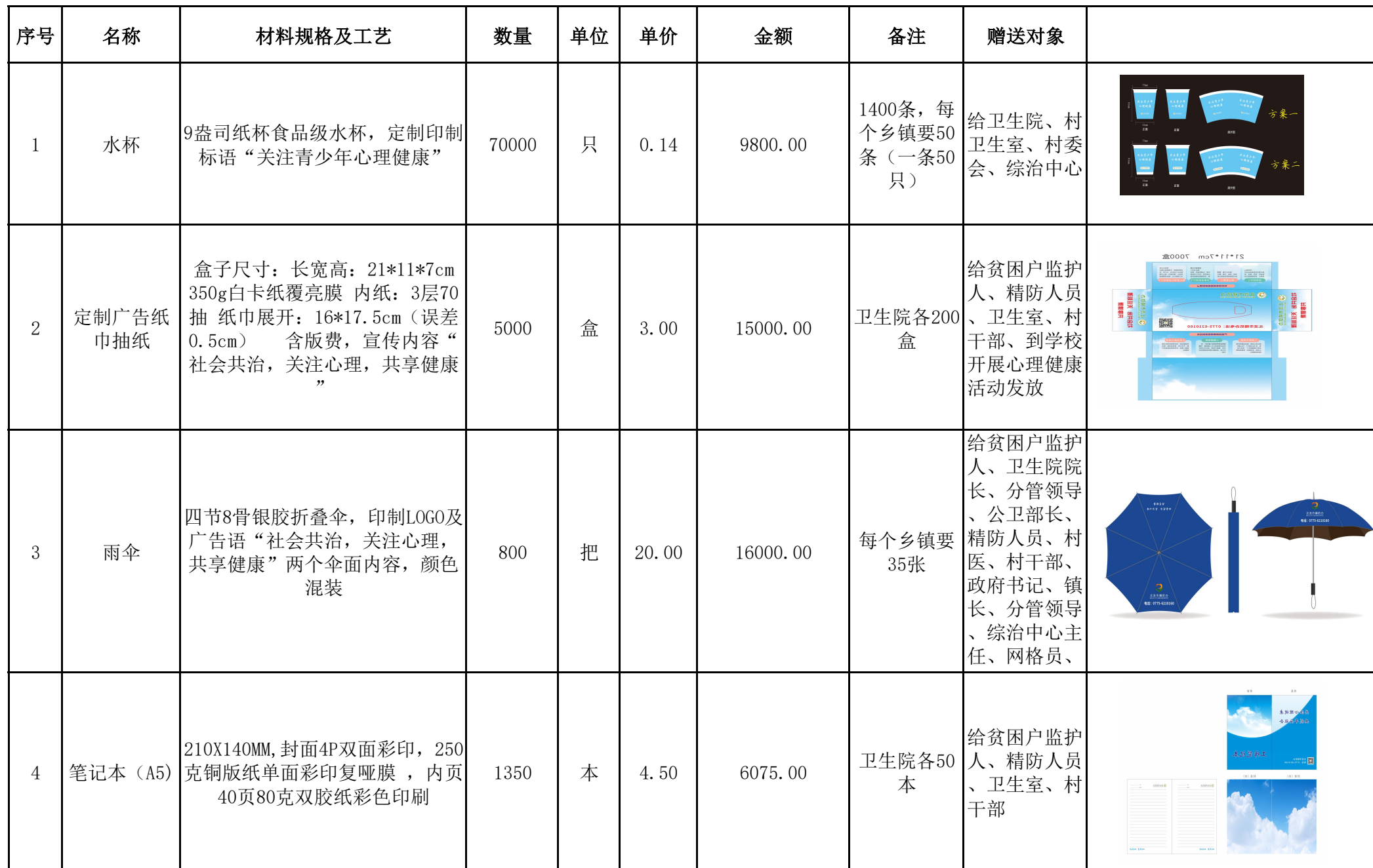
北流市医院世界精防日宣传活动宣传物料报价